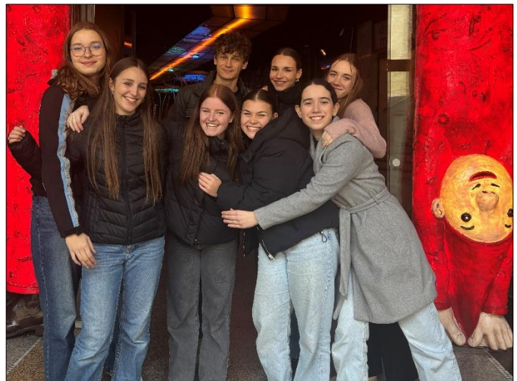
Popcorn 13. 12. 2018 při finále Čtenáře na jevišti a 9. 11. 2024 na Přeletu nad loutkářským hnízdem v Minoru