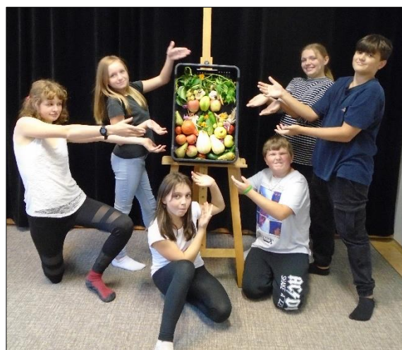
...a soubor LDO Naplno při zeleninové instalaci pro Oživené obrazy.

„Tvůj život je tím nejlepším projektem, na kterém kdy budeš pracovat.“