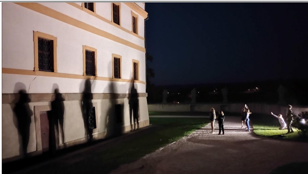
Večerní procházky a neskrývaný obdiv před osvětleným hospitém ve večerních a nočních hodinách. Majestátní, podivuhodný, tichý. Takový je Kuks. A nepochybně nejen pro nás výtvarníky.