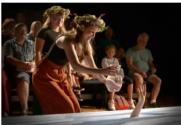
„Rusalje2022“ na Jiráskově Hronovu