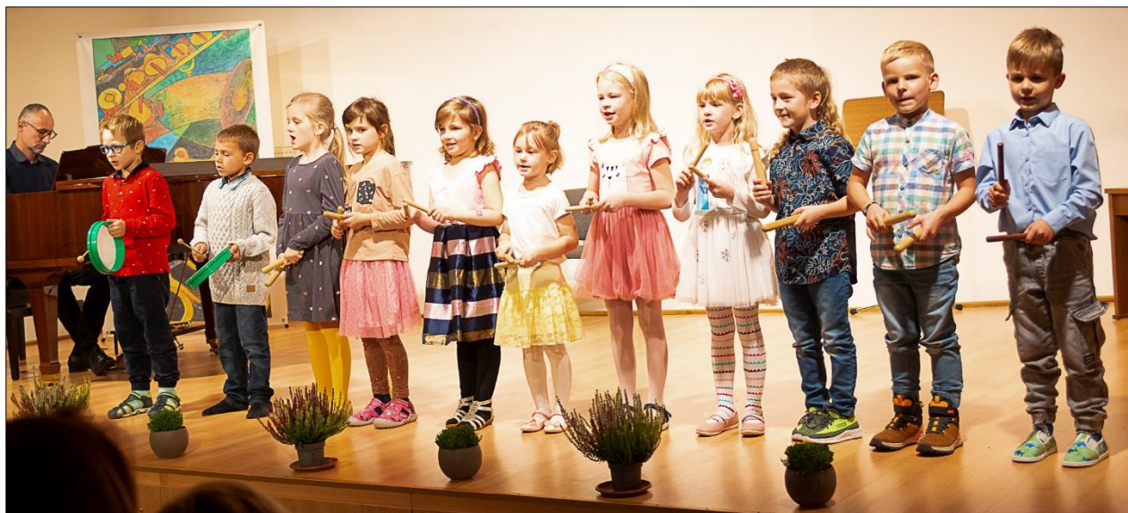
Hudební příprava na Naši úrodučku