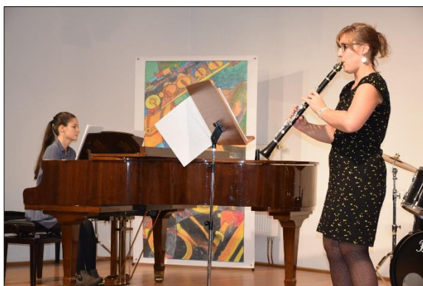
z Podzimního koncertu