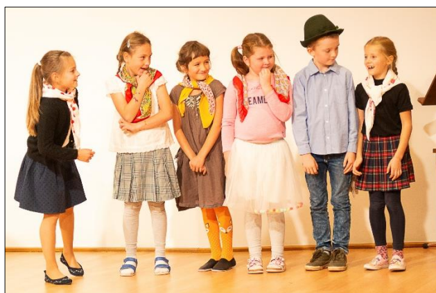
„Naše máma vzkazuje vám rendlík...“ (2. ročník) a zmíněná zkouška inscenace (Možná už jo: Bitva s kancem)