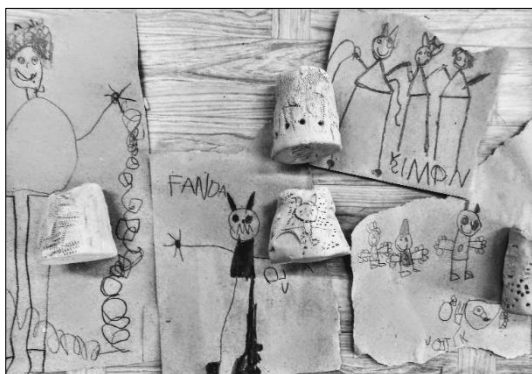
Čertíci (kresba a keramika)

Těšení na Vánoce, ukázky štědrovečerní večeře, jmelí, čerti, andělé a suchá stébla travin ve výtvarce