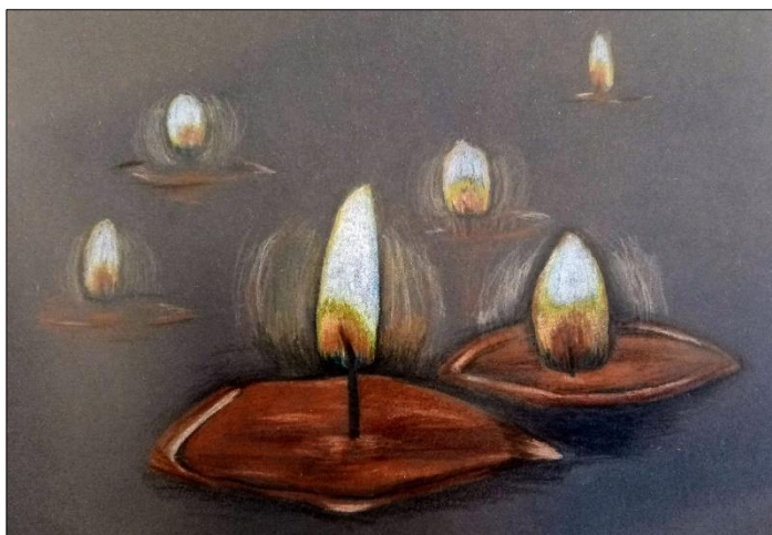
Světýlka (Lenka Nýčová)

Jak si vyložit chování lodičky, když ...zůstane u břehu - v příštím roce vás nečekají žádné změny, zůstanete doma... dopluje daleko - vydáte se na cesty, vaše plány by se měly vydařit... se při plavbě dotýká jiné lodičky - čeká vás láska a dobré mezilidské vztahy, čím déle lodičky plují vedle sebe, tím bude vztah pevnější... utvoří kruh s ostatními - můžete se těšit na bezproblémové soužití, vzájemnou úctu, přátelství a toleranci... se ocitne uprostřed ostatních lodiček - potřebujete ochranu a pomoc... se točí v kruhu - jste nerozhodní, budete přešlapovat na místě... vydrží nejdéle na vodě, nebo svíčka dlouho svítí - čeká vás dlouhý a šťastný život... se okamžitě potopí - veškerá snaha zlepšit svou situaci bude marná... je jedna mimo rodinný kruh - její tvůrce v nadcházejícím roce rodinu opustí... sama dopluje k druhému břehu - úspěšně a bez pomoci získáte to, po čem toužíte... vaše lodička potopí jinou lodičku - chcete své plány uskutečnit za každou cenu... nabere vodu, ale přesto dorazí k druhému břehu - svůj záměr uskutečníte s velkými potížemi... zhasne svíčka v okamžiku, kdy vyslovujete svou otázku - jste neupřímní k sobě i k ostatním... zhasne svíčka v plující lodičce, která se sice nepotopí, ale zůstane v přístavu - je vám ve skutečnosti záležitost, na kterou jste se ptali, lhostejná. Novinky.cz