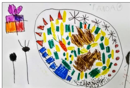
Štědrovečerní večeře (František Černý)