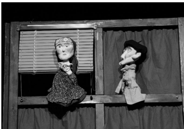
Convivium: „Všech pět mých“