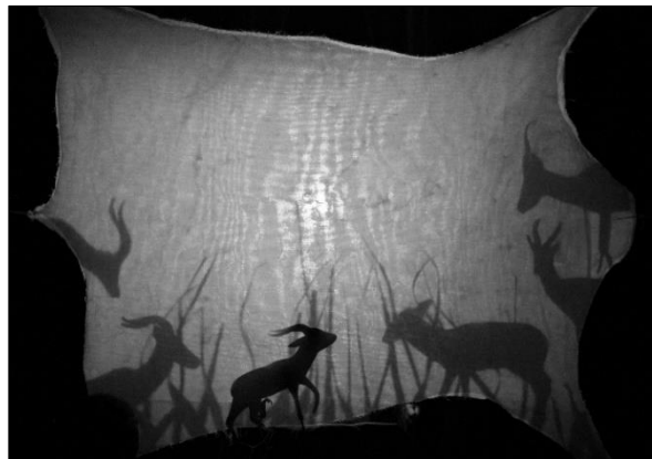
Je to tajný!: „A co antilopy?“

Loutky? Loutky! – výstava v muzeu přinesla několik představení a dílen pro děti z MŠ a ŠD