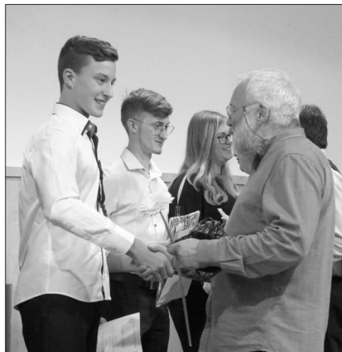
...a úsměvy, gratulace, poděkování i slzy na Absolventském koncertě...