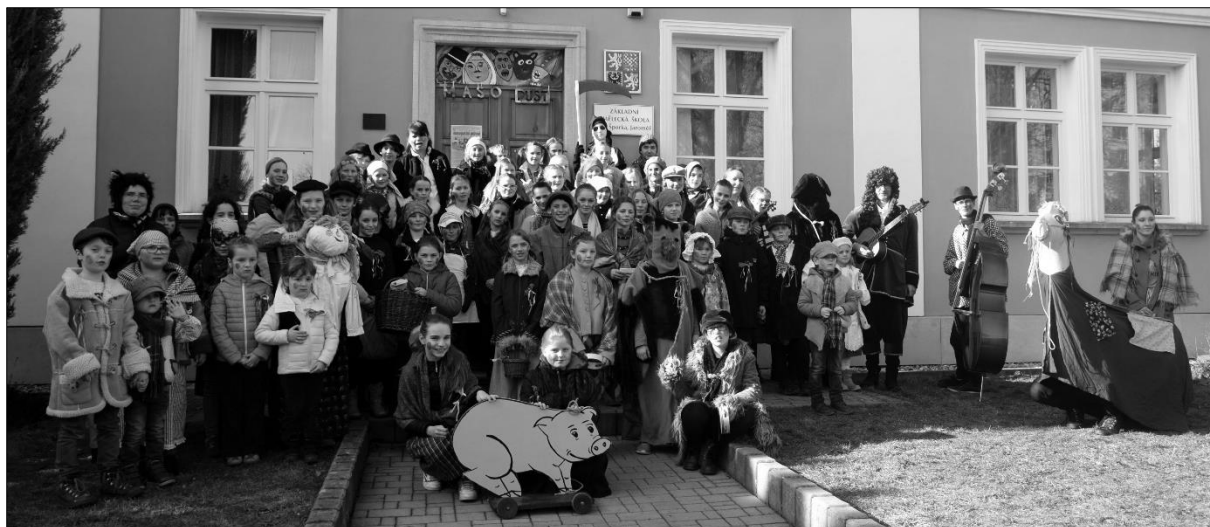
Masopustní průvod 2019: „My jsme se k vám přišli ptáti, smíme-li tu tancovat...“

PS: Chtěla jsem vám popřát, aby vaše starosti zmizely spolu s tajícím sněhem, ale tohle přirovnání není v našem blízkém okolí úplně na místě. Nevadí, krásné jaro! Bapu