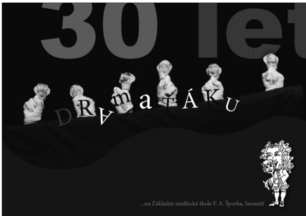
Titulní strana Výročenky „30 let Dramatáku na ZUŠ F. A. Šporka, Jaroměř“