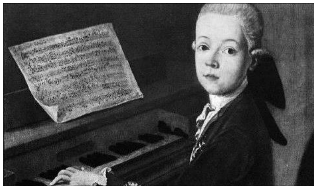
malý Wolfgang Amadeus Mozart