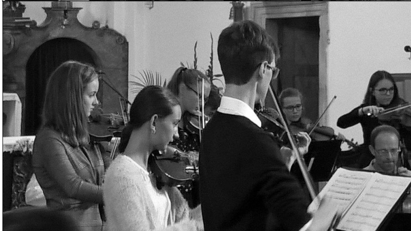
...smyčkový soubor Musica Sporcka v kostele sv. Jana Křtitele při oslavách výročí 700 let od první zmínky o obci Holohlavy.