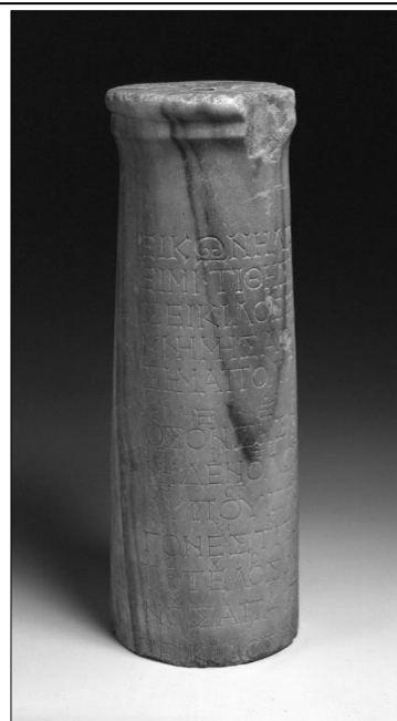
...první hudební památku na náhrobním kameni z dob starého Řecka...

přibližný překlad: „Vy hořící pochodně, nesmutněte. I za dlouhý život, čas si žádá svou daň.“