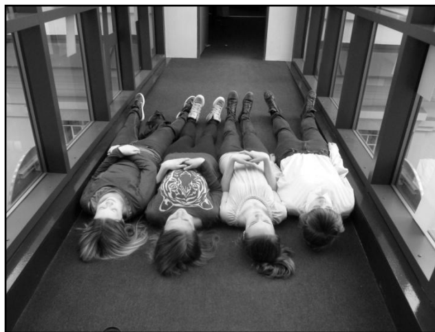
část souboru Nikdo nic neví mezi představeními na loutkářské přehlídce v divadle Drak

Základní umělecká škola F. A. Šporka, Jaroměř, Na Obci 142, 551 01, Jaroměř, tel. 491 812 356 e-mail : zus.jaromer@quick.cz , www.zus-jaromer.cz