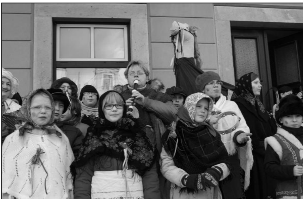
z loňského Masopustního průvodu

Akci podporují: Johnova pekárna Josefov, PěCé Pekárny a cukrárny Náchod a.s., Pizzerie Nasavrcký Jaroměř, Řeznictví Uhlíř Jaroměř a Cukrárna Vilma, Dvůr Králové n/L. Děkujeme! Jé (psáno pro Zpravodaj)