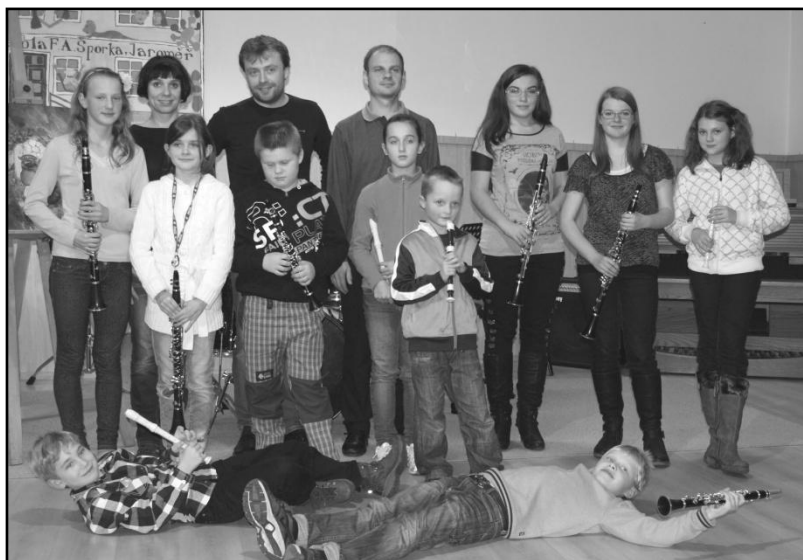
Účastníci dílny se svými učiteli