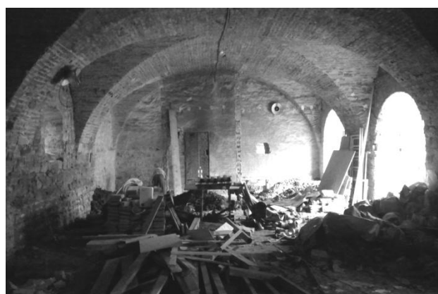
a budoucí divadlo LDO v Hospitalu v Kuksu.