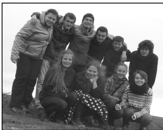
...bývalé a nynější dramtačky při pouštění draků...